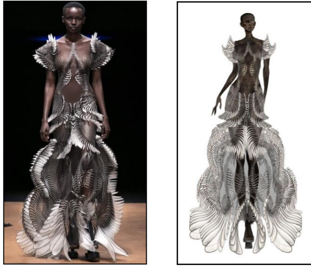
صورة (2) أسلوب التصميم والرسم على الاسكتش 28

ثانياً: التصميم المباشر بالورق على المانيكان المصغر: