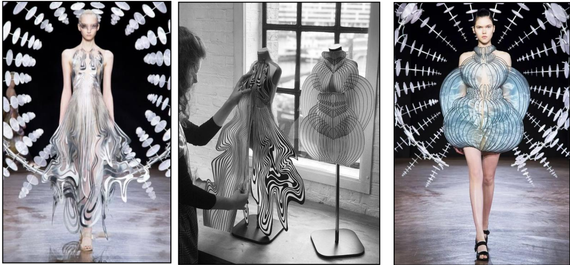
صورة (3) أسلوب التصميم المباشر بالورق على المانيكان 27

التنفيذ داخل الأتيليه لإيجاد النسب والأنماط الصحيحة.