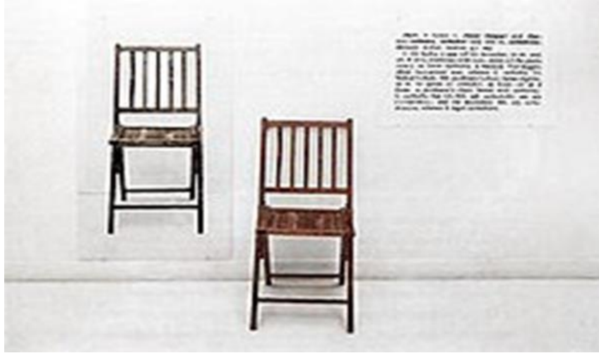
صورة (1) جوزيف كوزوث Joseph Kosuth في، واحد وثلاثة كراسي عام (1965م) 30

كما يذكر Peter Osborne عن Joseph Kosuth أشهر رواد الفن المفاهيمي " أن الفن غير موجود في الأشياء، ولكن الفن موجود في مفهوم الفنان عن العمل الفني " 24 .